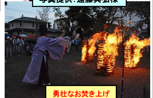
勇壮なお焚き上げ