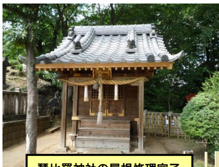
琴比羅神社の屋根修理完了