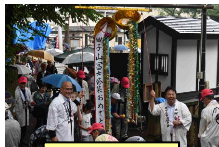
お祝いのクスダマ割り