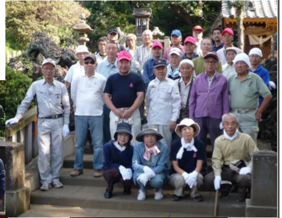
9月24日の草刈り清掃