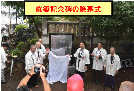
修築記念碑の除幕式