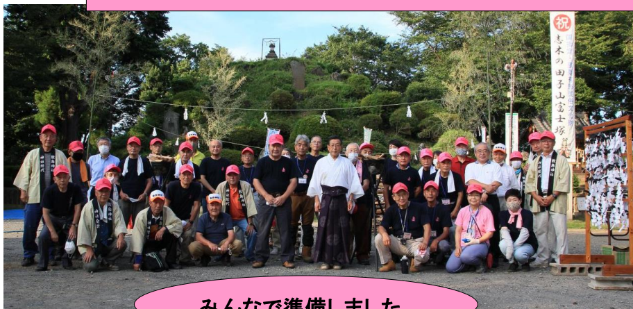
みんなで準備しました