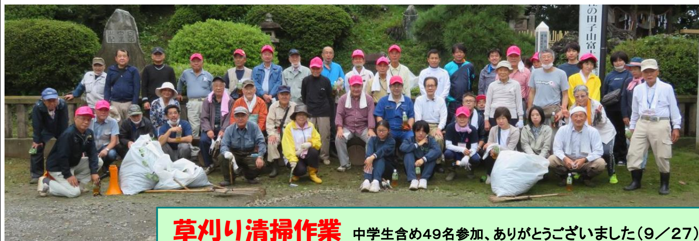
草刈り清掃作業 中学生含め49名参加、ありがとうございました(9/27)