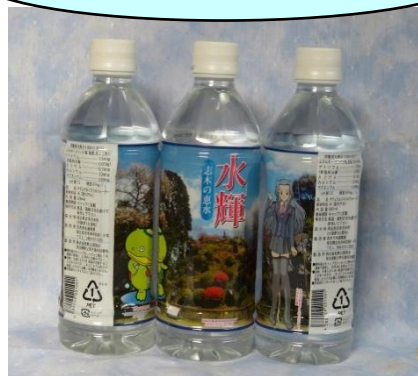
ペットボトルのラベル

記念切手(500円/シート)が、志木市商工会と志木市民会館で販売中(残り少しです)