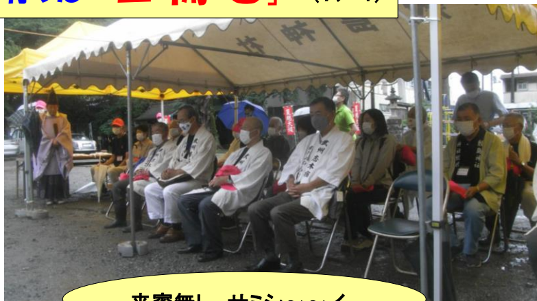
来賓無し、サミシ〜〜イ