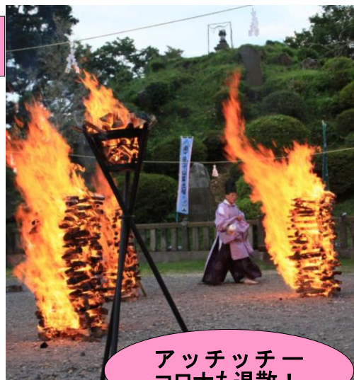
アッチッチー コロナも退散!