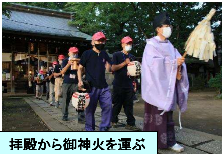
拝殿から御神火を運ぶ