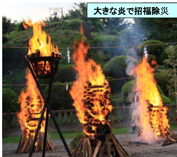
大きな炎で招福除災

【山仕舞い(お焚き上げ)】 8月21日(日)夕方5時半より、敷島神社境内にて、「コロナ退散」の願いも込めて、勇壮に行われました。「招福除災」・「火除け」の御利益があると言われている「燃えさし」を無料配布しました。