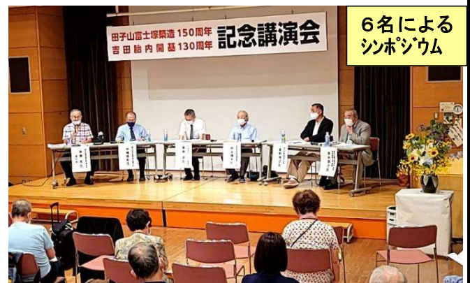
6名によるシンポジウム