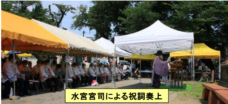
水宮宮司による祝詞奏上

山梨県から富士吉田市長・富士山北口御師団歳司にお出でいただき、志木市長・市議会議員・市議会議員・県会議員・衆議院議員、その他多くのご来賓をお迎えし、猛暑の中にもかかわらず、子どもさんを含めて約2000人(主催者発表)の人出となり、楽しんでいただきました。ありがとうございました。