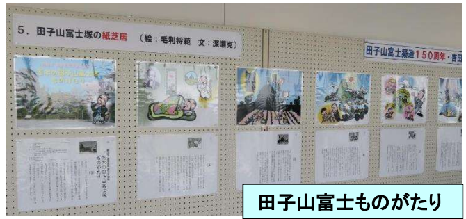
田子山富士ものがたり

【山仕舞い(お焚き上げ)】 8月21日(日)夕方5時半より、敷島神社境内にて、「コロナ退散」の願いも込めて、勇壮に行われました。「招福除災」・「火除け」の御利益があると言われている「燃えさし」を無料配布しました。