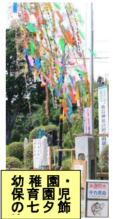
幼稚園・保育園児の七夕飾