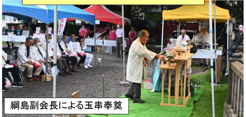
綱島副会長による玉串奉奠

景観道路渡り初め式を実施(7/16) 神社参道がきれいになりました ありがとうございました！