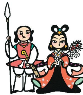
ニニギノミコトと コノハナサクヤヒメノミコト (切り絵: 毛利将範氏)