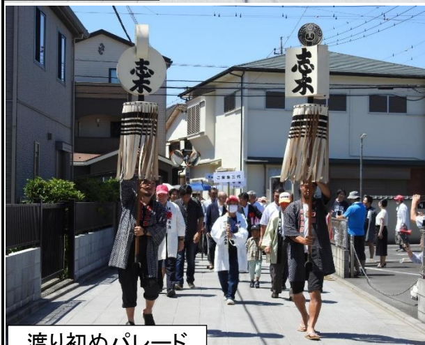
渡り初めパレード