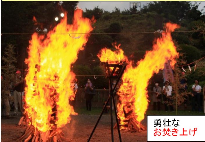
勇壮な お焚き上げ