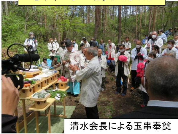
清水会長による玉串奉奠