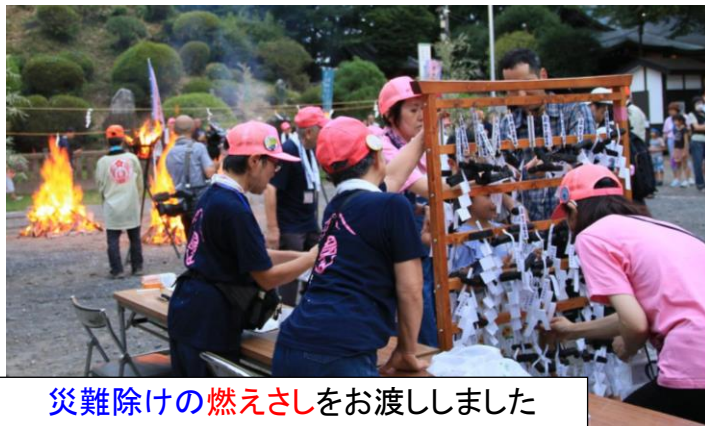
災難除けの燃えさしをお渡ししました